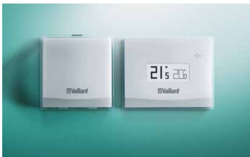
vSMART installata a parete e il suo dispositivo WiFi