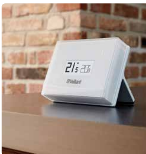
vSMART non installata a parete

vSMART trasforma il tuo smartphone o tablet in un sistema di controllo a distanza per il tuo riscaldamento. Ovunque tu sia e qualsiasi cosa tu stia facendo potrai controllare e regolare il comfort di casa in modo rapido ed estremamente intuitivo sfruttando la tua rete WiFi.